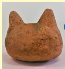
⑦ じよもにゃん (ネコ頭形土製品) 縄文時代中期～晩期