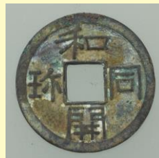
③ 和同開珎 奈良時代・8世紀