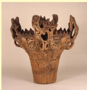
④ 火焰型土器 縄文時代中期