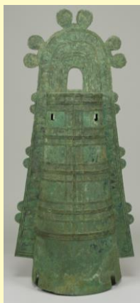
⑤ 袈裟襷文銅鐸 (けさだすきもんどうたく) 弥生時代(後期)・1～3世紀