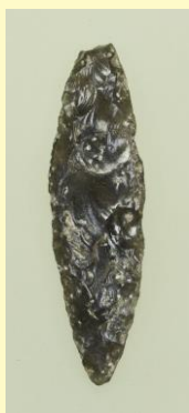
② 槍先形尖頭器 (やりさきがたせんとうき) 旧石器時代(後期)・ 前18000年