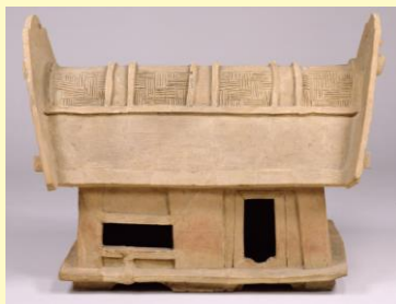
⑥ 埴輪 切妻造家 古墳時代・5世紀