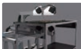
出土遺物の3次元計測