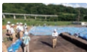
埋蔵文化財調査における3次元計測